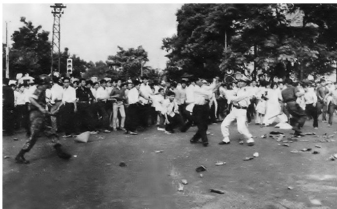
Cuộc đấu tranh mùa Pháp nạn 1963 chống chế độ độc tài Ngô Đình Diệm