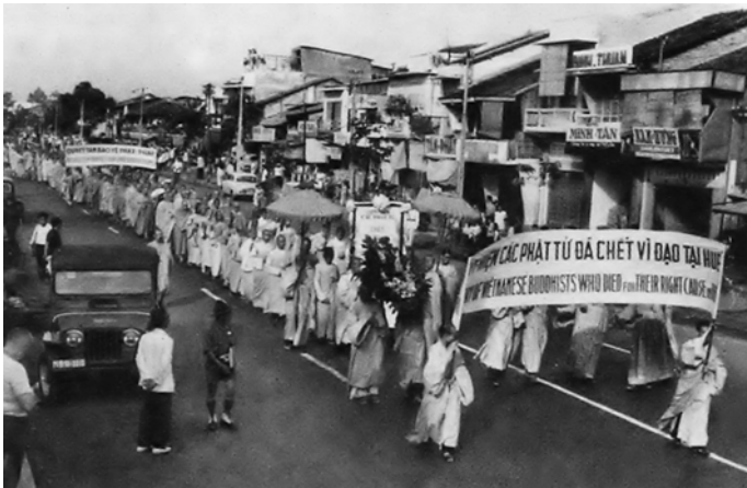
Cuộc đấu tranh mùa Pháp nạn 1963 chống chế độ độc tài Ngô Đình Diệm