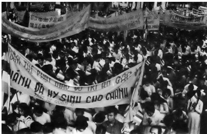
Cuộc đấu tranh mùa Pháp nạn 1963 chống chế độ độc tài Ngô Đình Diệm