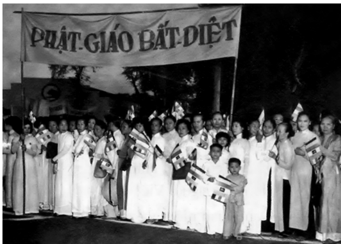
Cuộc đấu tranh mùa Pháp nạn 1963 chống chế độ độc tài Ngô Đình Diệm