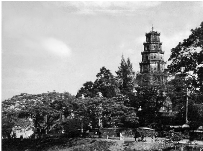
Chùa Thiên Mụ – Huế