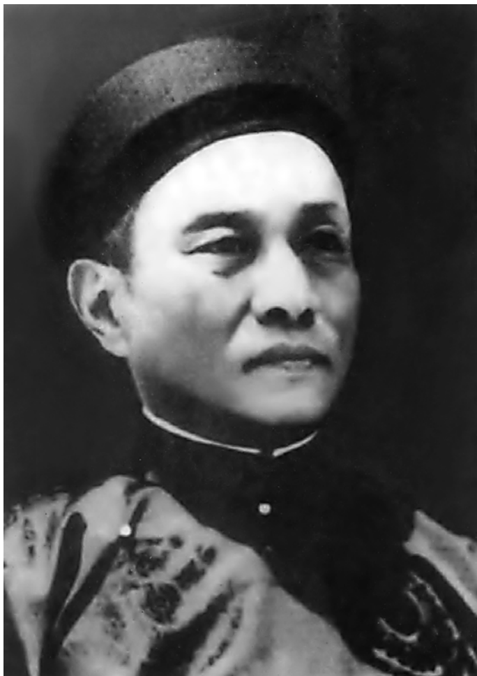
CHÁNH TRÍ MAI THỌ TRUYỀN (1905-1973)